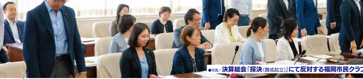
●写真/決算総会「採決(賛成起立)」にて反対する福岡市民クラブ